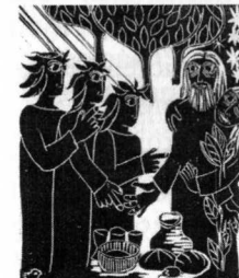
Besuch der drei Frem- den bei Abraham und Sara

vor dem Gottesdienst ab 15.30 Uhr mit vielen interessanten Informationen und Spezialitäten.